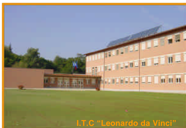
I.T.C. "Leonardo da Vinci"