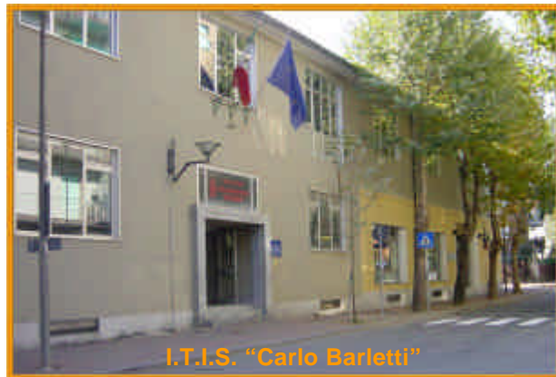
I.T.I.S. "Carlo Barletti"