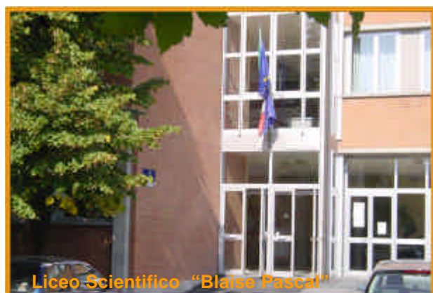
Liceo Scientifico "Blaise Pascal"